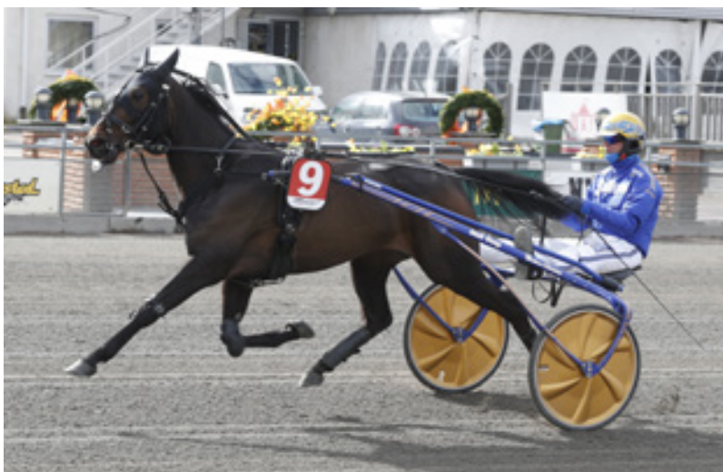
FRODO S, rekord na kratko distanco 1:10,6